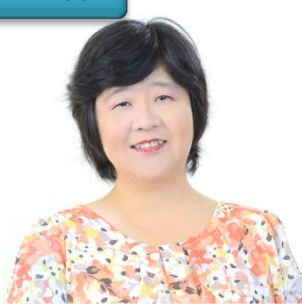
相良 (あい) タロット、手相、数秘術 など