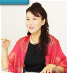
菜里 (しおり) 手相、四柱推命、風水など