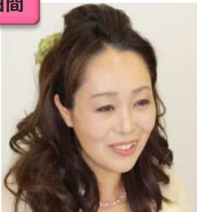
マダム・クララ (まだむ・くらら) 手相、オラクルカード、 九星気学など