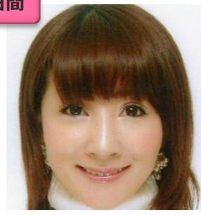
サトリーヌ・FUJIWARA タロットカード、ホロスコープ、ラブカード、 周易、姓名判断、四柱推命、算命学、 九星気学、六壬神課など