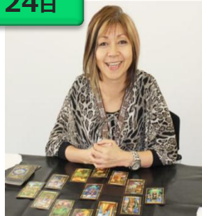
安沙蘭 (あしやら) タロット、風水、手相 など