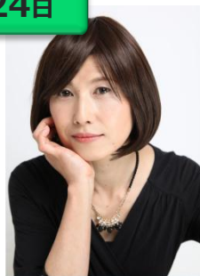
湖香ほのか (こがほのか) 西洋占星術、ルーン、タ ロットカードなど